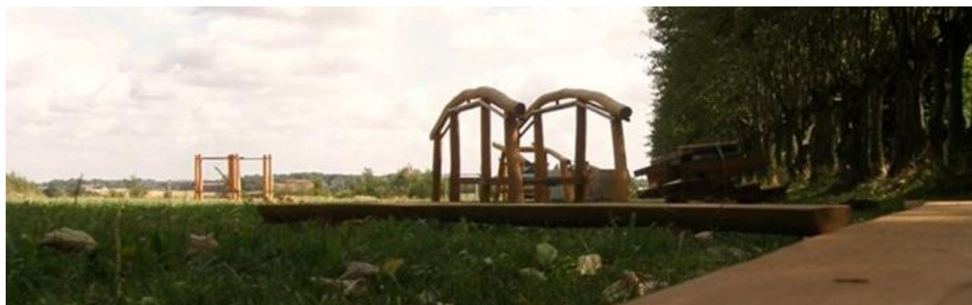
Kundby Fitness Park

Ved udgangen af 2015 var det i alt 62.600 kr. i uforbrugte midler. Disse midler blev overført til 2016-puljen.