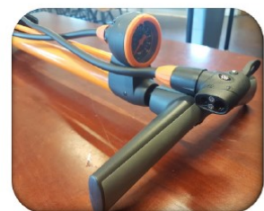
En god cykelpumpe med barmåler