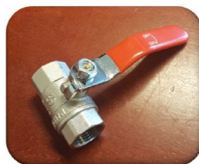
Kuglehane med langt greb (1/2 tomme)