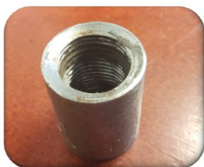
Overgang med muffe (1/2 tomme)