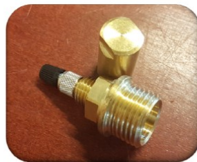
Pumpenippel med hætte (1/2 tomme)