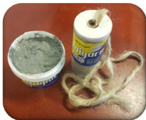
Pakningsgarn og pakningssalve

Følg trinene på næste side for at bygge en affyringsrampe til lufraketter.