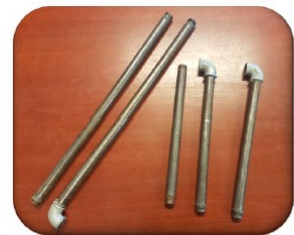
2 * 500mm rør (1/2 tomme) 3 * 200mm rør (1/2 tomme) 3 * vinkler (1/2 tomme)