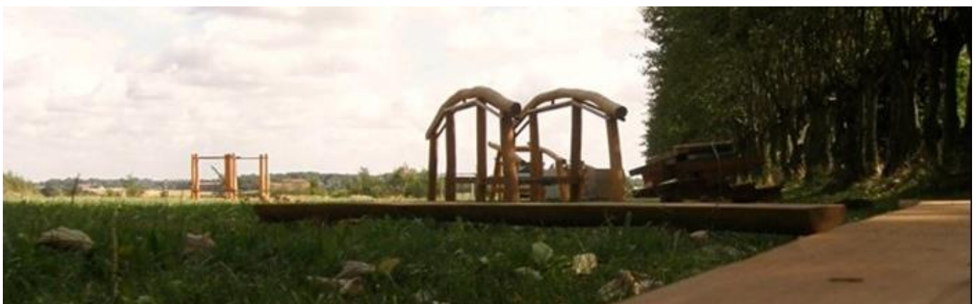
Kundby Fitness Park

Ved udgangen af 2015 var det i alt 62.600 kr. i uforbrugte midler. Disse midler blev overført til 2016-puljen.