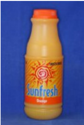
Appelsinjuice pH: 3,8