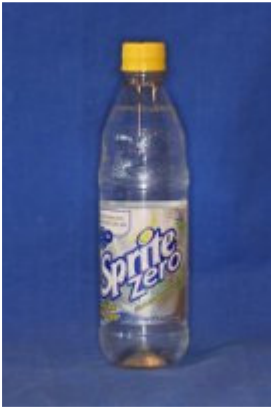
Sprite Zero pH: 2,8