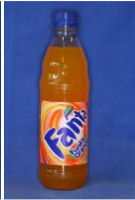
Fanta pH: 2,9