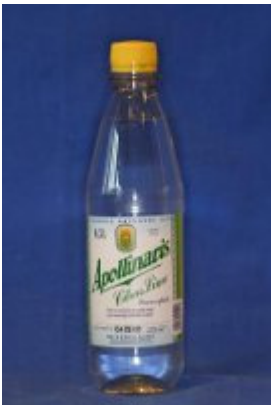
Danskvand pH: 4,0 - 5,4