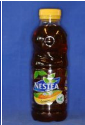
Ice Tea pH: 4,0