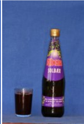
Ribena Solbær pH: 3,0