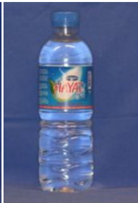
Vand pH: 7,0