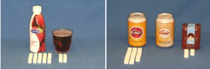
Cultura drik - Saft