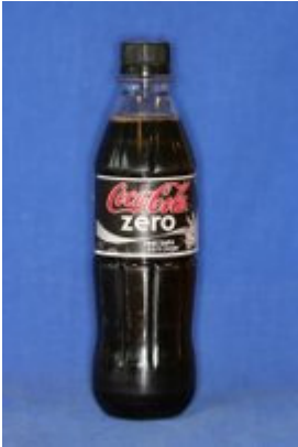
Coca Cola Zero pH: 3,0