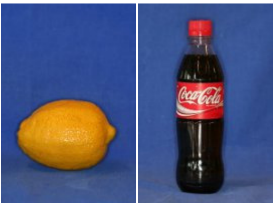
Citron pH: 2,3

De fleste typer af sodavand og juice indeholder former af syre. Ud fra pH-værdien kan man se om væsken ætser tænderne. Alt væske med en pH-værdi på mindre end 5.5 er skadeligt for tænderne.