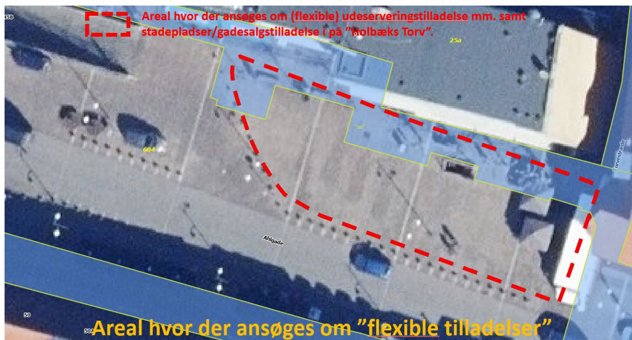
Figur 2 "Holbæk Torv" - Arealer hvor der kan søges om særskilt vareudstillingstilladelse og/eller tilladelse til at opstille stadepladser/gadesalg

Der kan også søges om særskilt udeserveringstilladelse, vareudstillingstilladelse og/eller tilladelse til at opstille stadepladser/gadesalg på pladser f.eks. Torvet i Holbæk og på de dele af Ahlgade, der er gågade. Torvet udgør et samlet areal, hvor der kan ansøges om "fleksibel brug" af hele eller dele af Torvets areal. Disse "fleksible tilladelser" rummer et krav, med varselsfrist (1 uges varsel (7 dage) af Holbæk Kommune), om at hele eller dele af det ansøgte areal skal ryddes i de perioder hvor hele Torvet skal bruges til større arrangementer. De ansøgere, der ønsker at anvende Torvet, skal udarbejde en samlet plan for henholdsvis udeserverings-, vareudstillings- og/ eller stadepladsarealer, som vedhæftes ansøgningen.