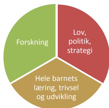
Holbæk Kommunes kvalitetsforståelse